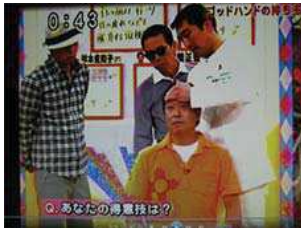
国民的バラエティー番組にゴットハンドとして出演